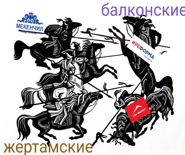
Иллюстрация «Битва в октябре» (2020). А. Филатова на базе линогравюры «Эпизод сражения» (1972–1980) Т.

Протесты не несут в себе насильственный потенциал и, видимо, поэтому не рассматриваются властью и правящими элитами как опасность. Несмотря на это, первая группа неактивно использует закон как инструмент для реализации своих требований. Помимо использования визуального языка, группа в основном ограничивается официальными жалобами, письмами с требованиями. Пока со стороны группы в адрес государственных органов не зафиксировано коллективных судебных исков.